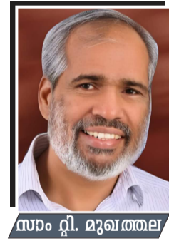
സാം റ്റി. മുഖത്തല

സന്ദേശ യാത്രകൾ കൊണ്ടായിട്ടുണ്ട്. ലഹരിക്കെതിരെ ശക്തമായ നടപടിയെയും, ബോധവൽക്കരണവും കൗൺസിലിംഗും ഏറ്റവും നല്ലതാണ്. ഇത്തരം സർക്കാർ നടപടികളെയും സാമൂഹ്യ പ്രവർത്തനത്തെയും മുക്തകണ്ടം പ്രശംസിക്കുന്നു. എന്നാൽ; മനുഷ്യനെ ഇത്തരം തിന്മകളിലേക്ക് നയിക്കുന്ന എല്ലാ റ്റിന്റെയും പിന്നിൽ; മനുഷ്യനിൽ കുടികൊള്ളുന്ന പാപമാണ്. പാപത്തിൽ നിന്ന് മോചനം വന്നേ പറ്റുകയുള്ളൂ. സുവിശേഷം ആണ് മനുഷ്യന് രൂപാന്തരം വരുത്തുന്നത്. യേശുവിലൂടെ മനുഷ്യകുലത്തിന് വരുന്ന ആത്യന്തിക പരിവർത്തനം നാം പറഞ്ഞ് കൊണ്ടേയിരിക്കുക. ഈ സമയത്ത് സമൂഹത്തിൽ സുവിശേഷീകരണത്തിന്റെ പ്രാധാന്യം വർദ്ധിക്കുകയാണ്.